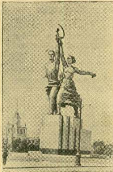
Москва. Скульптура В. Мухомовой, установленная на площади перед Всесоюзной сельскохозяйственной выставкой.