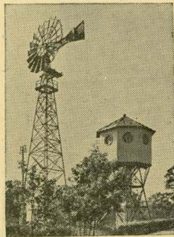
Москва. Всесоюзная сельскохозяйственная выставка. Ветро-насосная станция с ветродвигателем «ТВ-8».