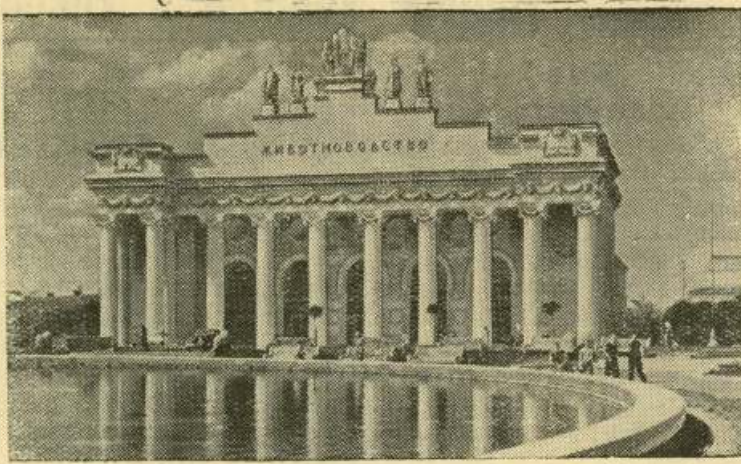
Из опыта участников Всесоюзной сельскохозяйственной выставки.