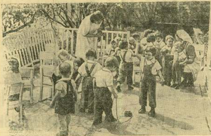
Правительство Чехословацкой Республики проявляет большую заботу о детях. Для них строятся удобные и просторные школы, детские сады, ясли.

тысяч центнеров зерна. Колхоз приступил к сдаче хлеба государству. На заготовительные пункты отправлено 1400 центнеров первосортной пшеницы.