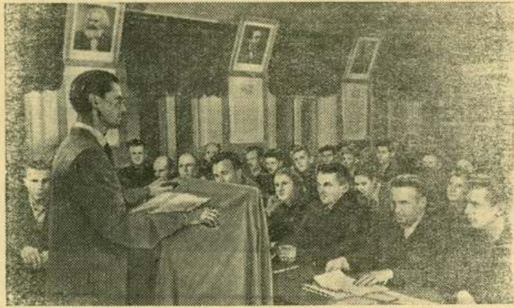
Пензенская область. В городе Каменка открылся вечерний Университет марксизма-ленинизма. Более ста коммунистов и беспартийных повышают здесь свои политические знания.

НА СНИМКЕ: на лекции в вечернем университете.