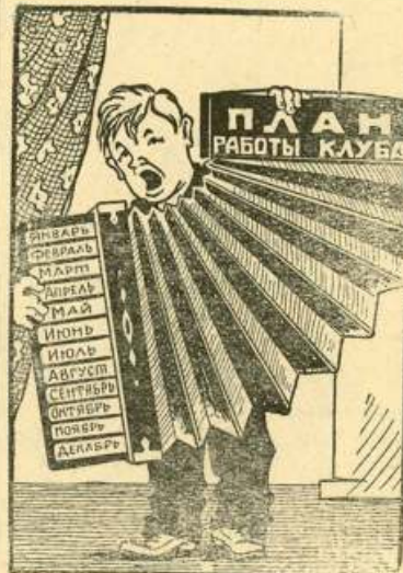
Ты играй моя гармонь, Буду подпевать и я. Заменить должна ты все Культмероприятия.

В клубах и избах-читальнях вся работа сводится к танцам в ущерб другим культурно-массовым мероприятиям.