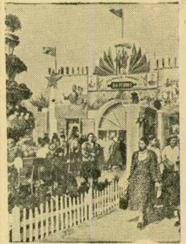
Краснодарский край. В Курганском районе открылась районная сельская зрительная выставка. НА СНИМКЕ: посетители осматривают выставку.

Обязательство свое ремонтники выполняют добросовестно. Они повысили производительность труда до 120 процентов, экономят средства и материалы. Ф. ЧУМАКОВ.